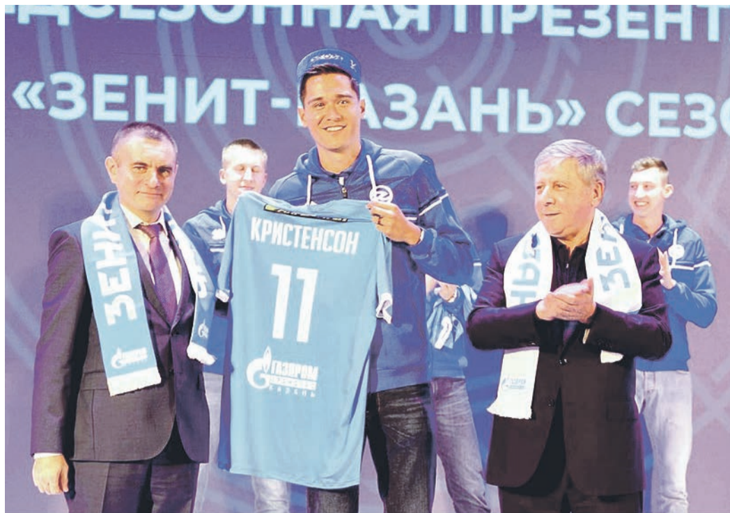
С таким пополнением «Зенит-Казань» может рассчитывать на самые большие победы