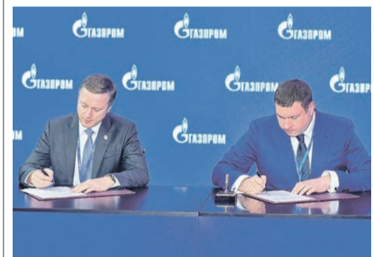
Вице-премьер – министр промышленности и торговли Татарстана Альберт Каримов и генеральный директор ООО «Газпром газомоторное топливо» Тимур Соин во время подписания соглашения

На Петербургском международном газовом форуме – 2021 подписаны документы, направленные на развитие рынка газомоторного топлива в России.