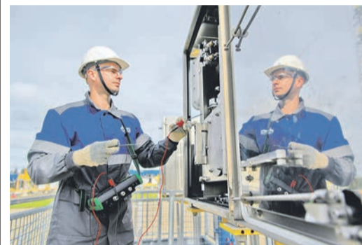
Поставки газа в Китай по газопроводу «Сила Сибири» после завершения плановых работ, проводившихся с 22 по 29 сентября, продолжают увеличиваться

Поставки газа в Китай по газопроводу «Сила Сибири» после завершения плановых работ, проводившихся с 22 по 29 сентября, продолжают увеличиваться.