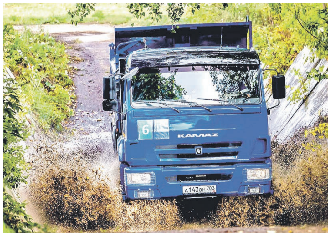
Под управлением классного водителя для «КАМАЗа» нет никаких преград

З авершился финальный этап конкурса профессионального мастерства среди водителей дочерних предприятий ПАО «Газпром» в зоне Приволжского федерального округа.