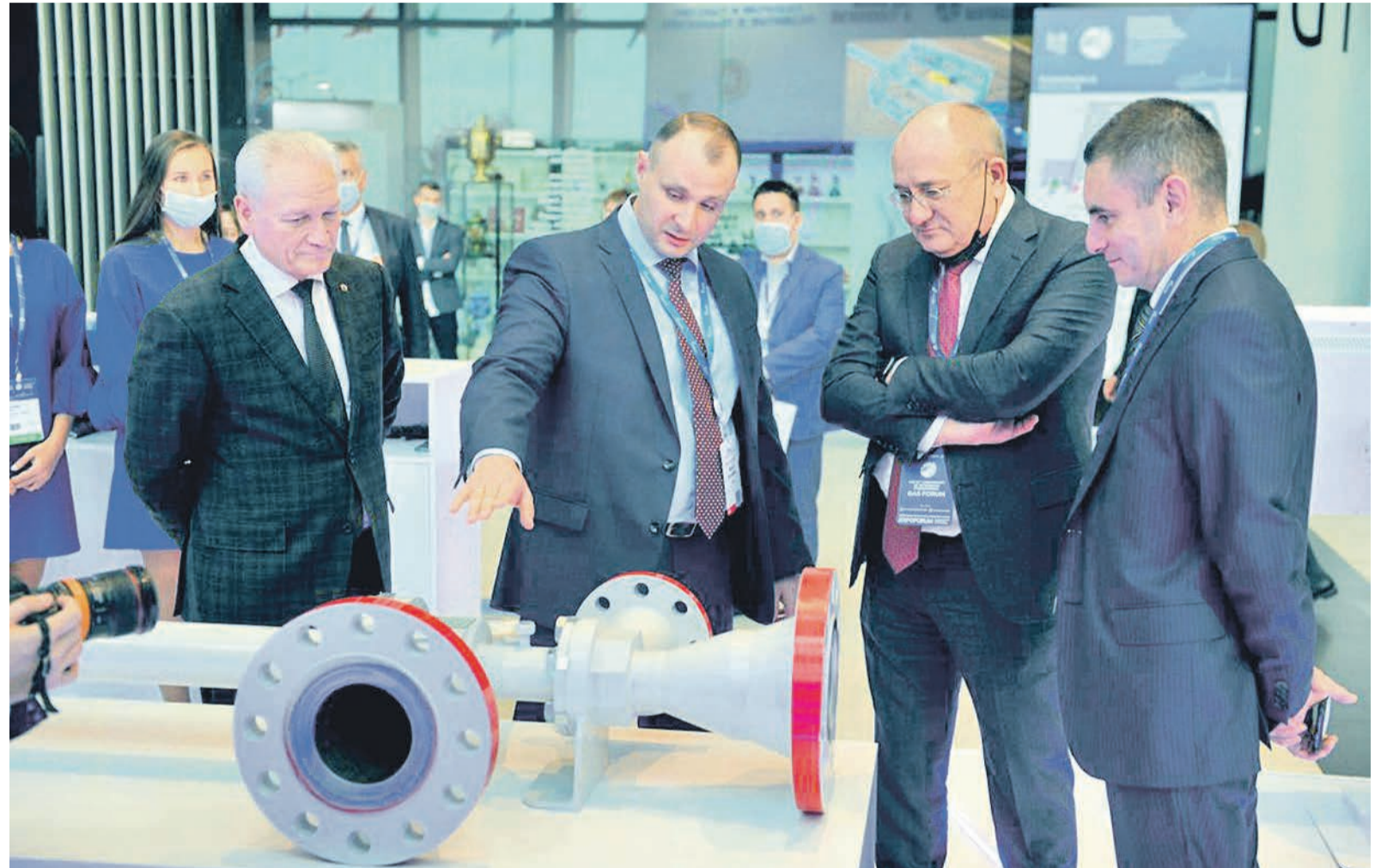
Совместная экспозиция ООО «Газпром трансгаз Казань» и Республики Татарстан, посвящённая Году науки и технологий, вызвала большой интерес у специалистов

В октябре в Санкт-Петербурге прошло знаковое событие в экономике страны – Международный газовый форум. Северная столица уже в десятый раз принимала у себя газовиков, на этот раз – из 370 компаний из разных стран. Деловая программа форума была чрезвычайно насыщенной, а работа – плодотворной.